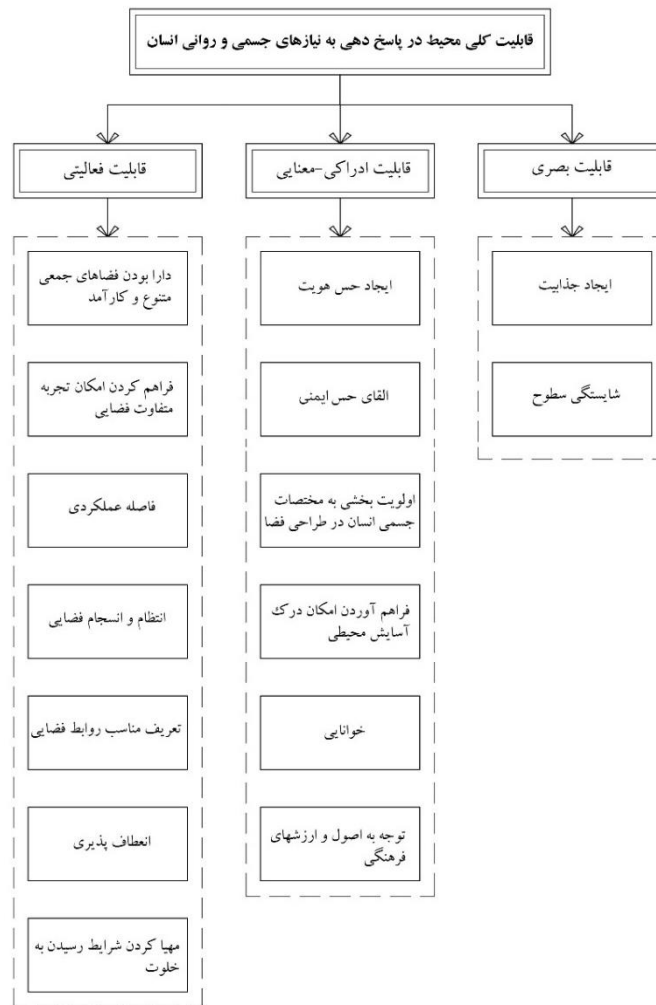
نمودار ۲. نمودار نمایشگر عامل محوری پژوهش و مقولات و مفاهیم مرتبط با آن

توجه داشت و در این راستا، دسته‌بندی‌های متفاوتی از عواملی که در بروز این قضیه مؤثرند شکل گرفت. هرچند در این خصوص، میزان تأثیر همه این عوامل، به یک‌میزان، از سمت مصاحبه‌شوندگان برآورد نشده است، ولی در یک دسته‌بندی کلی از عوامل مورد اشاره، مشخص شد بیشتر عواملی که از طرف مصاحبه‌شوندگان مورد تأکید قرار می‌گرفتند، در دسته عوامل بعد قابلیت فعالیتی فضا بودند (نمودار ۲). نکته قابل توجه دیگر، معرفی عواملی است که در