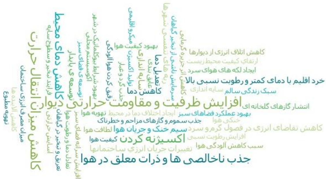
شکل ۱. ابر واژگان مرتبط با کدهای انتخابی کاهش آلودگی هوا در مجموعه‌های مسکونی با تأکید بر جداره‌های سبز

در پایان، شرح کدگذاری‌های انجام‌شده به صورت محوری در (جدول شماره ۲) آورده شده است که بر اساس آن کدها، مقوله‌ها و زیر مقوله‌ها نام‌گذاری و تشریح شده‌اند.