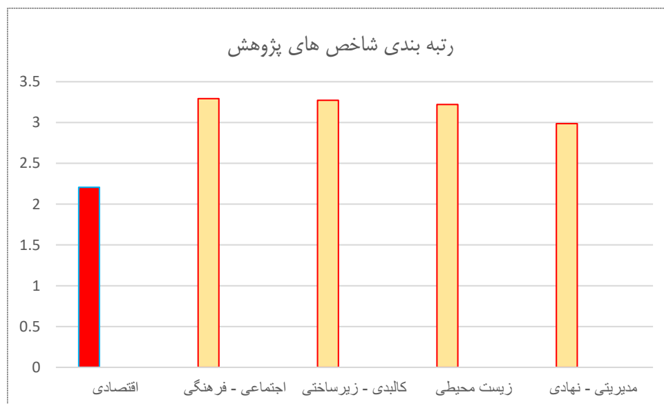
شکل ۳. نمودار رتبه بندی شاخص های تحقیق

(جدول شماره ۶) مقدار آماره کی دو ( \chi^2 )، درجه آزادی (df) و معنی داری آماری (sig) را نشان می دهد.