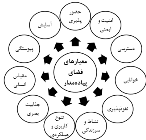
شکل ۱: معیارهای فضای پیاده‌مدار، نگارندگان بر گرفته از (آقاجانی و پندار ۱۴۰۰، ۲۰۹؛ مولوی و همکاران ۱۴۰۰، ۸۸۵؛ سیف‌الهی فخر و همکاران ۱۳۹۲، ۸۷؛ Sallis et al. 2016)

قابل ملاحظه در برنامه‌ریزی و طراحی فضاهای پیاده‌مدار را می‌توان ملاحظه کرد.