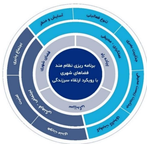
شکل ۲: مدل مفهومی پژوهش (نگارندگان)

این فضاها با توجه به ماهیتشان از نظر ادراک هویت فضایی، احساس تعلق به محیط و دریافت زیبایی از اهمیت اساسی برخوردارند و با جذب طیف وسیعی از گروه‌های اجتماعی به‌سوی خود، حس همگرایی، تعامل و برخورد مستقیم شهروندان را باوجود بینش‌ها، احساس‌ها، خواسته‌ها و گرایش‌های مختلف تقویت می‌نمایند و در نتیجه موجب ارتقاء حس سرزندگی و نشاط و پویایی هر چه بیشتر در فضا خواهند شد (Poortinga et al. 2020, 90; Sepe 2017, 725). بنابراین پیاده‌راه‌ها به‌موجب ایجاد آرامش روحی و روانی، رونق تجاری و افزایش رضایتمندی ساکنان، نقش قابل ملاحظه‌ای در ایجاد سرزندگی شهری دارند (محمدی ده چشمه ۱۴۰۰، ۲۸). مبتنی بر مؤلفه‌ها و شاخص‌های سنجش سه بعد فضای شهری، سرزندگی و پیاده‌راه؛ مؤلفه‌های ارتقاء سرزندگی در پیاده‌راه‌های شهری قابل تبیین است و شاخص‌های آن در دو بعد عملکردی-محیطی و اجتماعی-فرهنگی قابل دسته‌بندی است (شکل شماره ۲).