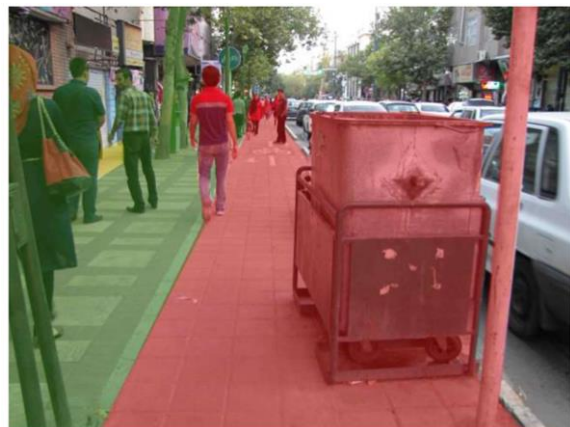
شکل ۵: مکان‌یابی نامناسب مبلمان شهری، نگارندگان

سال بیشترین درصد پاسخ‌دهندگان را با ۴۱ درصد شامل می‌شوند. از میان جامعه آماری، تقریباً ۱۴٪ دارای مدرک تحصیلی سیکل، ۲۰٪ دارای مدرک تحصیلی دیپلم، ۳۴٪ دارای مدرک تحصیلی لیسانس، ۲۵٪ دارای مدرک تحصیلی کارشناسی ارشد و ۶٪ دارای مدرک تحصیلی دکترا هستند که از این میان بیشترین تعداد را افرادی با مدرک تحصیلی لیسانس شامل می‌شوند.